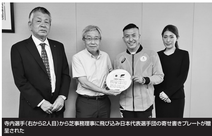
寺内選手(右から2人目)から芝事務理事に飛び込み日本代表選手団の寄せ書きプレートが贈呈された