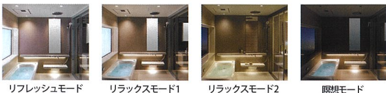
リフレッシュモード