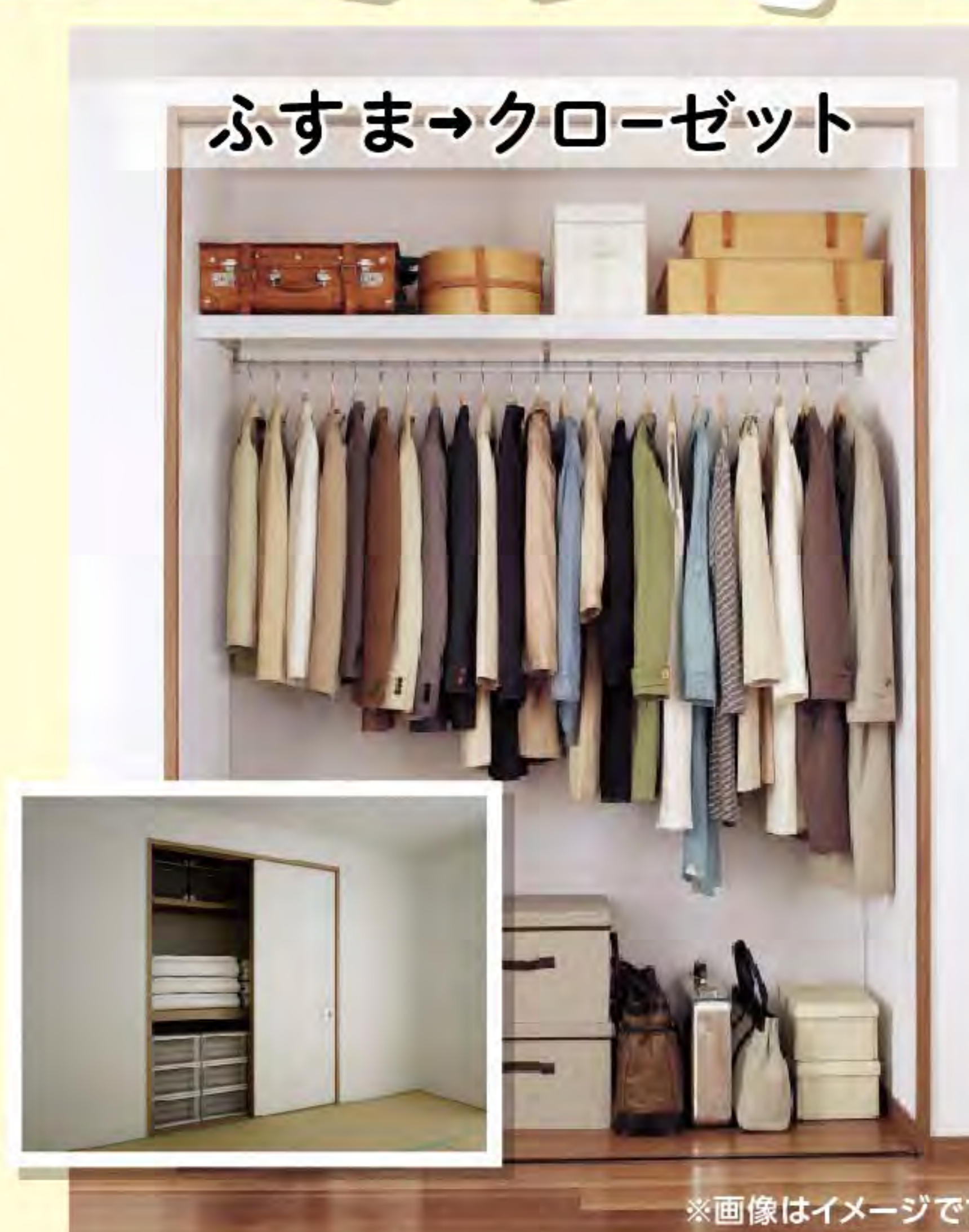
ふすま→クローゼット

オプション(ふすま→クローゼット工事) 196,000円 185,000円 税込203,500円