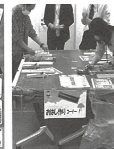
◀箸づくりや、駄菓子ももらえるストラックアウトなどの企画は、毎回大盛況。